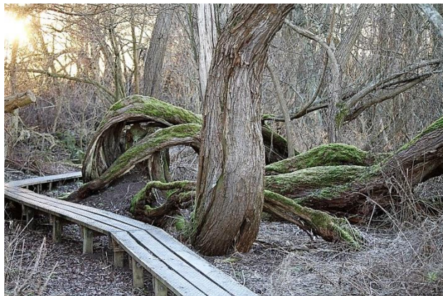
Naturstien ved Gundsømagle Sø

Udgivet af Ågerup og Omegns Landsbyråd med støtte fra Friluftsrådet. Januar 2024.